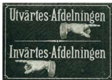
I Lund delades kirurgi och medicin i invärtes och utvärtesavdelningar under 1850-talet. Detta blev grunden till subspecialiteter inom respektive områden.

– Eternarkos och karbolsyresprängning lade grunden till att kirurgin lämnade barberar- och fältskärarstadiet genom den dramatiskt minskade dödligheten som följd av förbättrad hygien och anestesi.