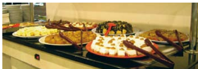
Varje dag bjöds det på många olika goda rätter.

En annan dag var vi till Atatürks hem, som numera är