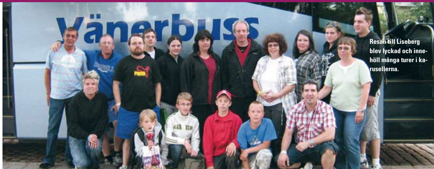
Resan till Liseberg blev lyckad och innehöll många turer i karusellerna.