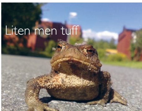
Liten men tuff

Tänk att det finns en plats och ett torp för alla med fibro. Och tänk att det finns en buss som går dit. Och tänk att det finns en hållplats att stiga av på. Och att det finns ett nummer på fibrobussen, och en tidtabell.