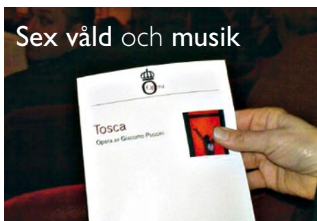
Sex våld och musik

Högt över däck sitter han och cyklar, med hela Stockholms inlopp för sina fötter. En unik vy som man bara får serverad när ett riktigt stort kryssningsfartyg angör stadsgården. Nästan alla andra på det stora kryssningsfartyget Constellation är iland för att göra stan, men han, han sitter där och cyklar. Man kunde tro att han njuter av utsikten, men det kunde inte vara mer fel. Han sitter och tittar på en liten tv-skärm, jag tror det är Oprah som har sitt soffprogram. Senare på eftermiddagen lämnar fartyget Stockholm för St Petersburg. Är det tillräckligt bra Tv-program, Jerry Springer kanske, så sitter han nog där och cyklar igen. Det gäller att hålla sig i trim.