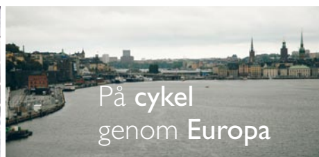
På cykel genom Europa

Den här Grännabilden är som ett pussel, man får ett akut behov av att vända bitar och samla kantbitarna i en liten hög för sig. Dessutom ingen entonig blåhimmel som man är tvingad att lägga, utan en skrovlig vityta som blir en lagom utmaning. Den skulle göra sig som ett 1500 bitars, tror jag. Undrar om man kan pusslifiera den nånstans?