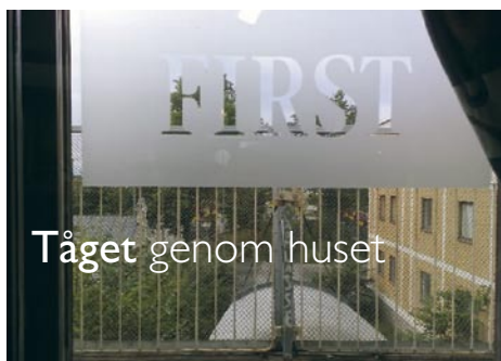
Tåget genom huset

För många är det kanske bara en tunnel bland många, men faktum är att alla Norrlandståg åker rakt igenom stadshotellet i Hudiksvall.