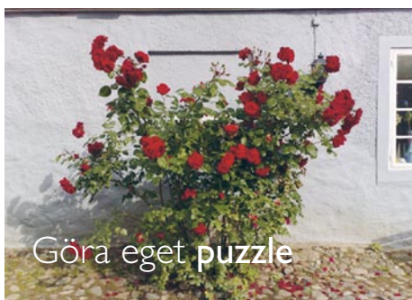
Göra eget puzzle

Öronvittnen meddelar att man kan höra plinget från bommarna när nattens godståg passerar genom receptionen, men själva tågen dundrar ytterst diskret vidare mot norr.