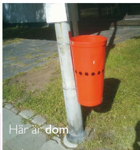
Här är dom

Sammanträden ser aldrig så ledsna ut, som när alla deltagare gått för att hämta sig en kopp. Men så här ser det antagligen ut på många andra platser också, just nu, just här, i alla tider. Det här är all verksamhets moder, alla idéers sköte. I askkopporna finns det numera värmeljus, kaffet kommer från automat och är sockerfritt men tankarna är desamma. Och känns det som lite stiltje, då kan man alltid göra en omorganisation.