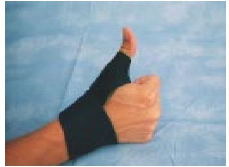
Tum- och handledsstöd Pris 275 kr

En burk- och flasköppnare med många användningsområden. Kan användas till att öppna skruvlock och kapsyler, oberoende av storlek och form. Perfekt för att bort vacuumlock. Består av två delar, en gummiplatta och ett handtag med gummiklädd yta. Burken placeras mellan plattan och handtaget vilket ger friktion vid vridning. Gör det möjligt att öppna burkar med en hand.