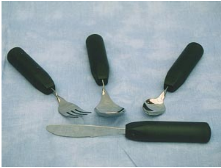
Bestick, lätta, böjbara Pris 94 kr

Samtliga bestick, utom knivarna, kan vid behov böjas i valfri vinkel till höger eller vänster och därmed anpassas individuellt till varje brukares behov. Besticken har ett extra tjockt handtag vilket gör dem mycket greppvänliga. Stålet är rostfritt och handtaget är gjort av miljövänlig återvinningsbar plast.