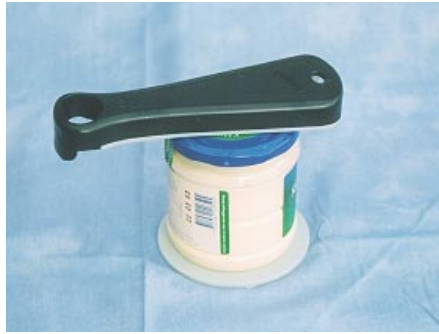
Burk- och flasköppnare TRIO Pris 125 kr

Samtliga bestick, utom knivarna, kan vid behov böjas i valfri vinkel till höger eller vänster och därmed anpassas individuellt till varje brukares behov. Besticken har ett extra tjockt handtag vilket gör dem mycket greppvänliga. Stålet är rostfritt och handtaget är gjort av miljövänlig återvinningsbar plast.