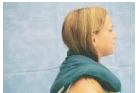
Värmekudde Cherry Shoulder Pack Pris 250 kr

Kanalsydd värmekudde som ligger behagligt runt hals och skuldror. Värms i ugn/mikrougn och ger därefter god värme i ca. 30 min. Kudden kan tvättas i låg temperatur (allt står i medföljande beskrivning) och kan ofta beställas i varierande färger. Innehåller körsbärskärnor. Andra kuddar kan innehålla vete.