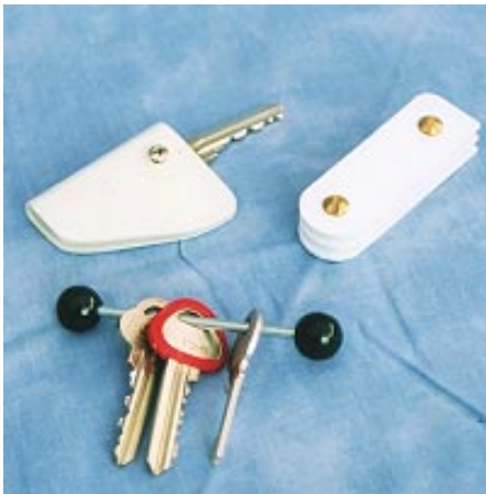
Grepp för en nyckel: 76 kr Grepp för två nycklar: 115 kr Hävarm för flera nycklar: 64 kr

Avlastar och skyddar tummen och handleden. Finns att köpa för båda händerna. Fästes med hjälp av kardborrband och kan därför dras åt efter behov. Passar alla storlekar. Färgen är marinblå och materialet är neoprene.