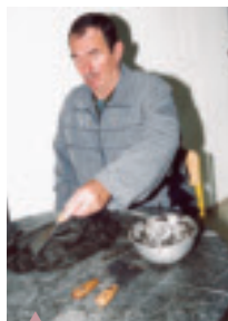
Arbetsterapi med lera i Fojnica.