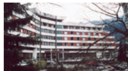
Patienter med reumatiska besvär utgör 60 procent av alla gäster/patienter på Fojnica Rehabiliteringscenter.

Så att här finns inte bara hela det klassiska utbudet av kurortsbehandlingar, med bad och massage, utan även avancerad medicinsk kompetens – 22 läkare – varav 12 har specialistkompetens inom rehabilitering, 85