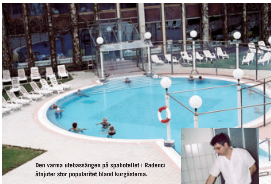
Den varma utebassängen på spahotellet i Radenci åtnjuter stor popularitet bland kurgästerna.

Det fyrstjärniga hotellet är verkligen lyxigt och måltiderna är överdådiga. Behandlingarna omfattar hela den klassiska spautbudet – med olika