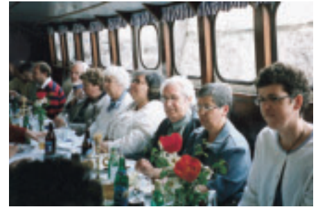
Lunchen serveras på kanalbåten Storholmen.