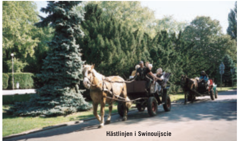
Hästlinjen i Swinoujście

Tidiga morgon anländer resenärerna till Polen. Det blir en halvtimmas bussresa innan vi når