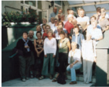
Reumatikerna uppmjukade i Polen.

Skriv till Landet runt, Reumatikertidningen, Box 12 851, 112 98 Stockholm. Och glöm inte bilderna, ibland säger de mer än tusen ord!