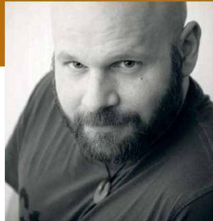
Text och recept: Göran Lindblad

Som kock lagar han gärna svensk husmanskost. Som designer är han särskilt intresserad av att skapa funktionella och vackra köksredskap som ska fungera för alla människor. I våras slutförde han sin designutbildning vid Växjö universitet och har som examensarbete utvecklat användarvänliga och ergonomiska redskap i trä.